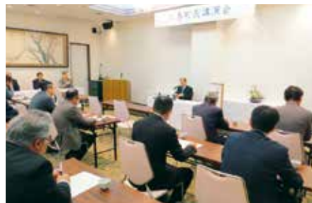
三春支部会員研修会