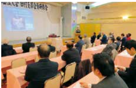
田村支部会員研修会