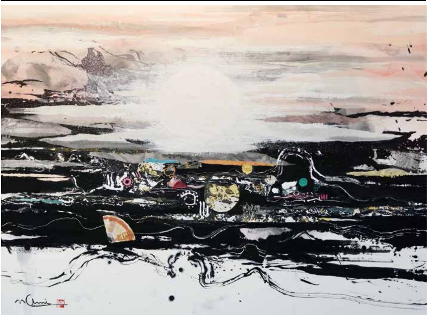
題名/初日輝く集落(40号) 提供/大波 天久 中国書法研究院客員教授