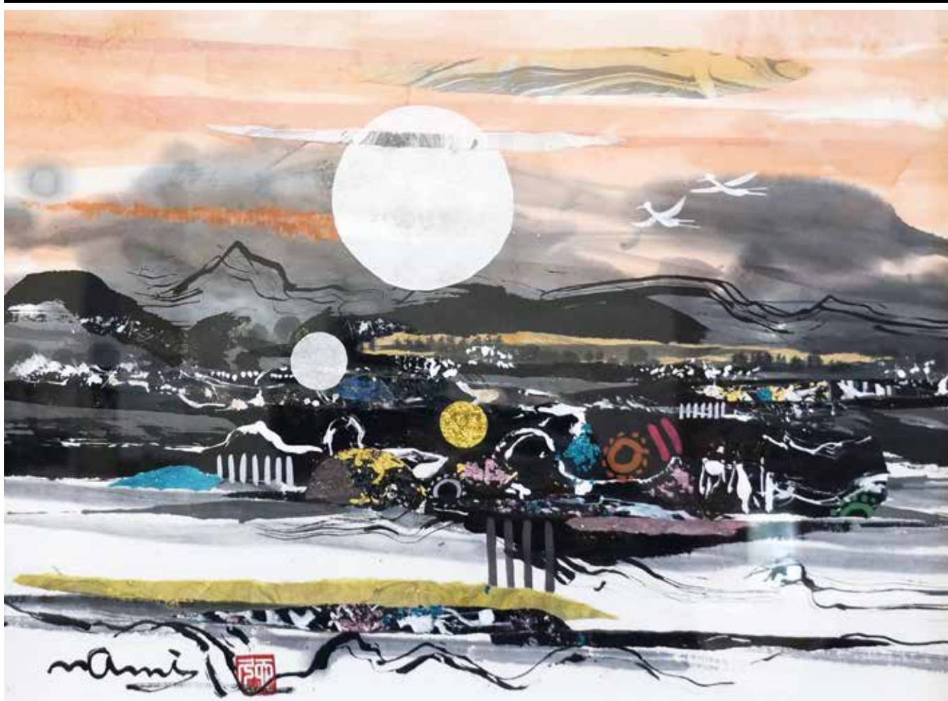
題名／輝く太陽(6号) 提供／大波 天久 中国書法研究院客員教授