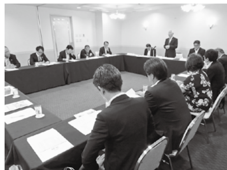
組織・厚生合同委員会

厚生委員会では、会員交流事業として、会員ゴルフ大会を郡山ゴルフ倶楽部で実施する。(10月18日開催) 只今参加者募集中ですので、多くの参加をお持ちしております。また、福利厚生制度推進施策について、受託会社より説明を受け、新商品及び制度の内容を周知、広報をしていく。