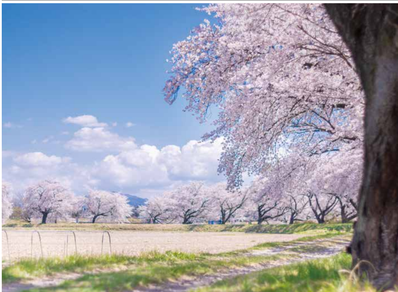
藤田川の桜並木(郡山市喜久田町)