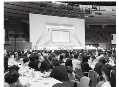
女性フォーラム広島大会