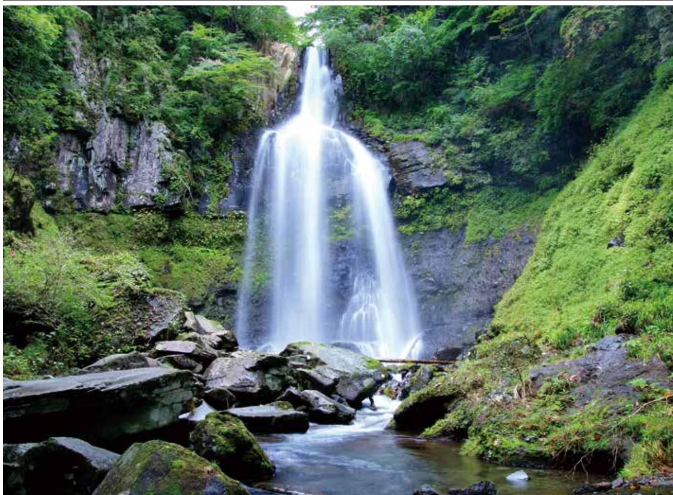
桃子ヶ滝(郡山市熱海町)