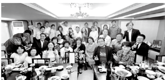
青年部・女性部 合同懇談会