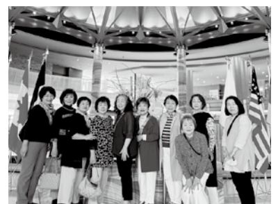
グランドプリンスホテル広島 (G7サミット会場)