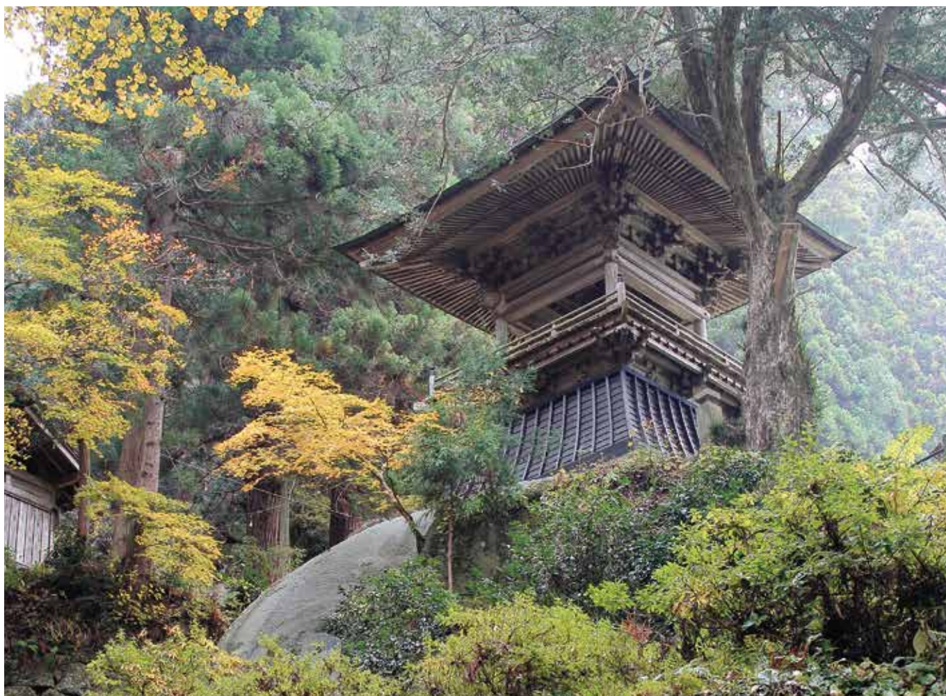
東堂山満福寺鎮楼(小野町小戸神)