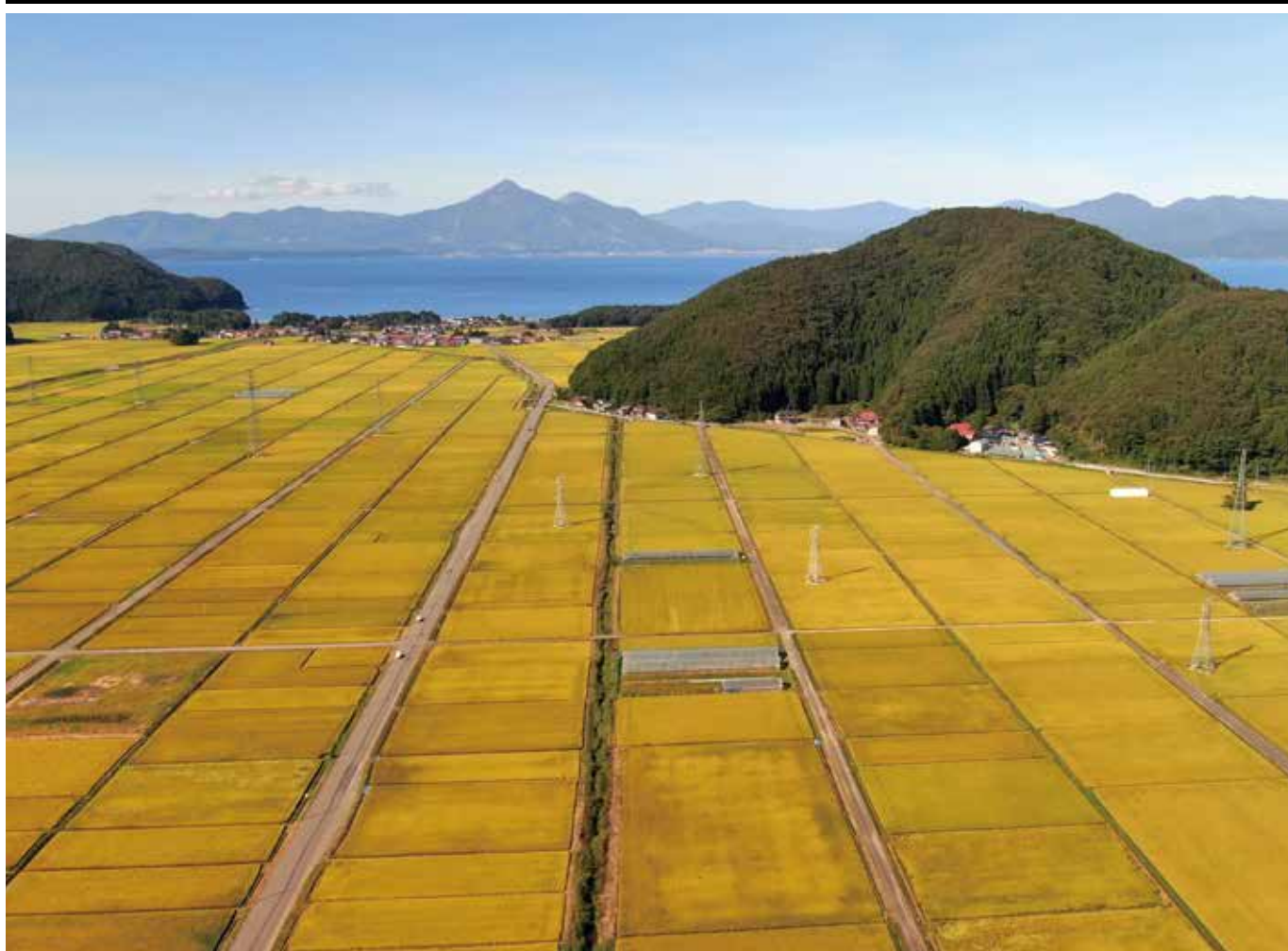
湖南地区の田んぼ(郡山市湖南町)