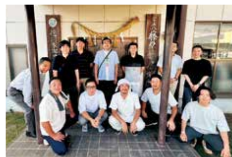
二十五代 藤原兼房日本刀鍛錬場

が入り混じった。スパッ、バキッと結果はそれぞれであったが非常に貴重な体験をさせていただいた。