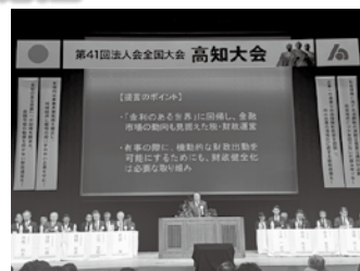
高知大会税制改正提言報告