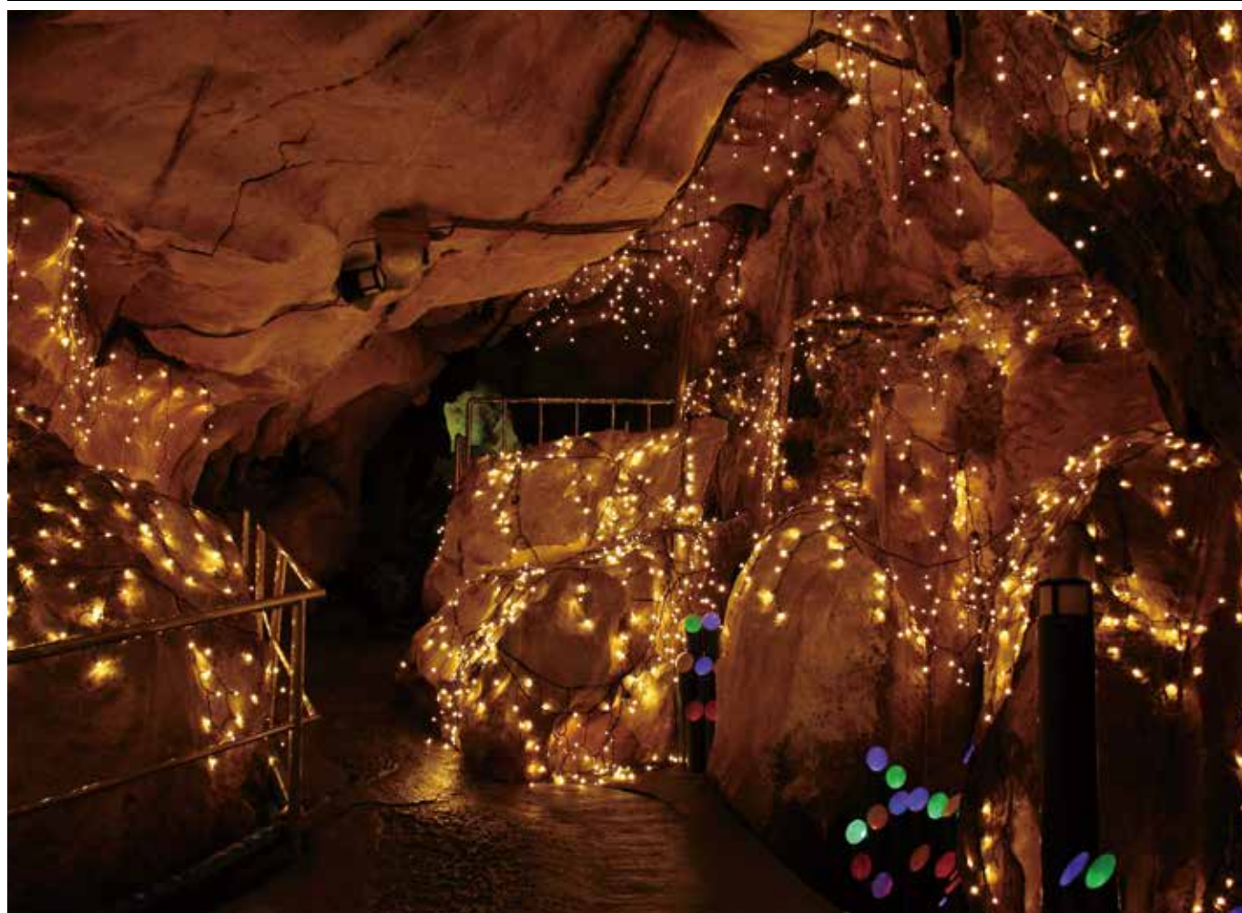
あぶくま洞(田村市滝根町)