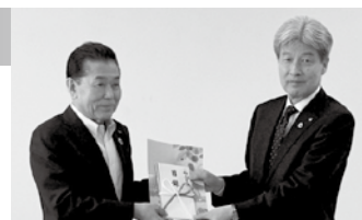
早崎会長(右)にクリアファイルを手渡す赤塚会長