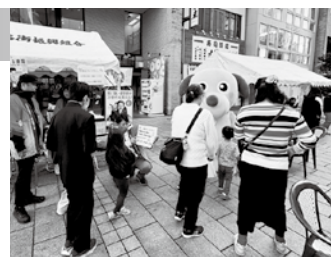
クイズラリーに挑戦する参加者

当日は「けんたくん」とともに、一般市民へ税を考える週間の広報や税の啓発活動を行いました。