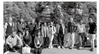
小野支部 視察研修会