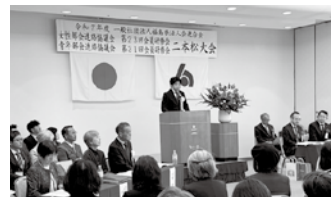
会員研修会「二本松大会」