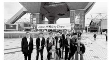
三春支部 視察研修会

ステージショーや体験型展示も充実しており、大人から子どもまで楽しめる内容でした。